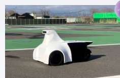
実機展示&先行トライアル大学の活動の紹介