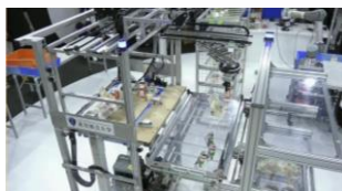
フューチャーコンビニエンスストアチャレンジに参加したロボットの展示とビデオ紹介